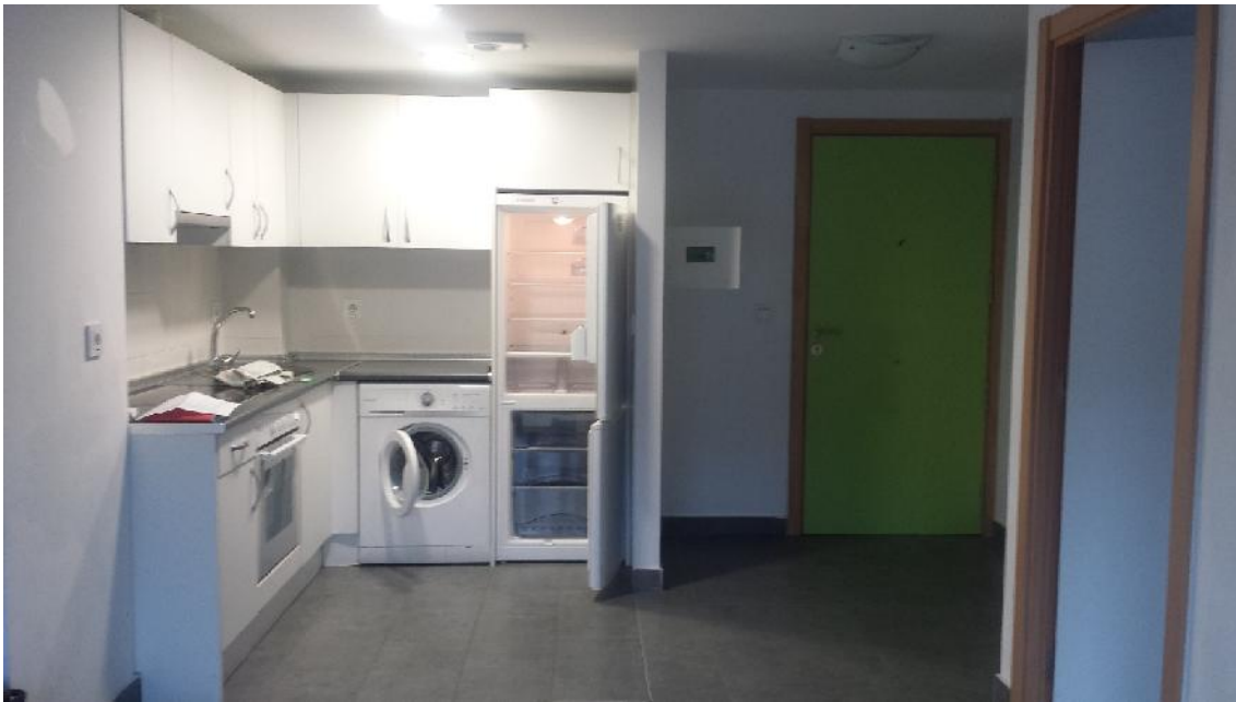
Sukaldea eta sarrera